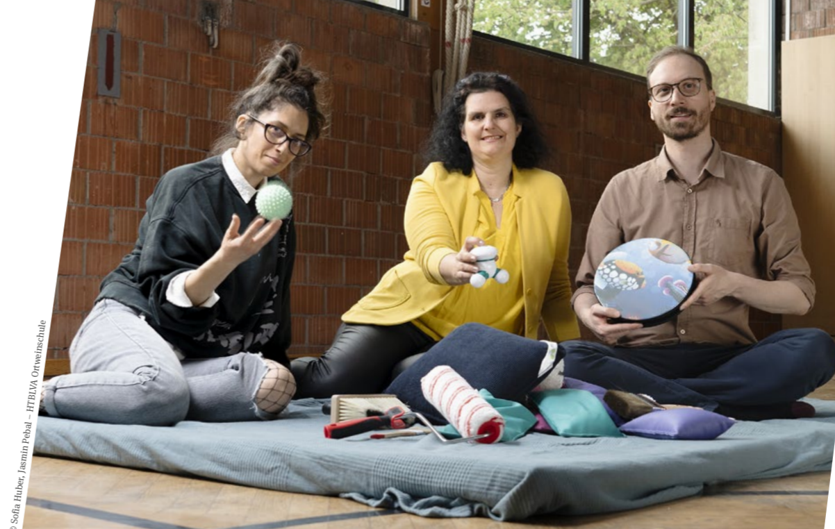
© Sofia Huber, Jasmin Pebal – HTBLVA Orwelschule

Marte Meo ist eine videobasierte Kommunikationsmethode, bei der es um eine Verbesserung der zwischenmenschlichen Interaktion und Kommunikation geht. Bezugspersonen erhalten in diesem Pilotprojekt konkrete Ideen anhand von Videofeedback, wie sie das Kind Schritt für Schritt in seiner sozial-emotionalen Entwicklung fördern können.