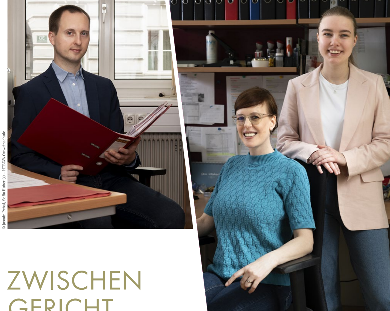
© Jasmin Pebal, Sofia Huber (2) - HTBLVA Ortwieschule