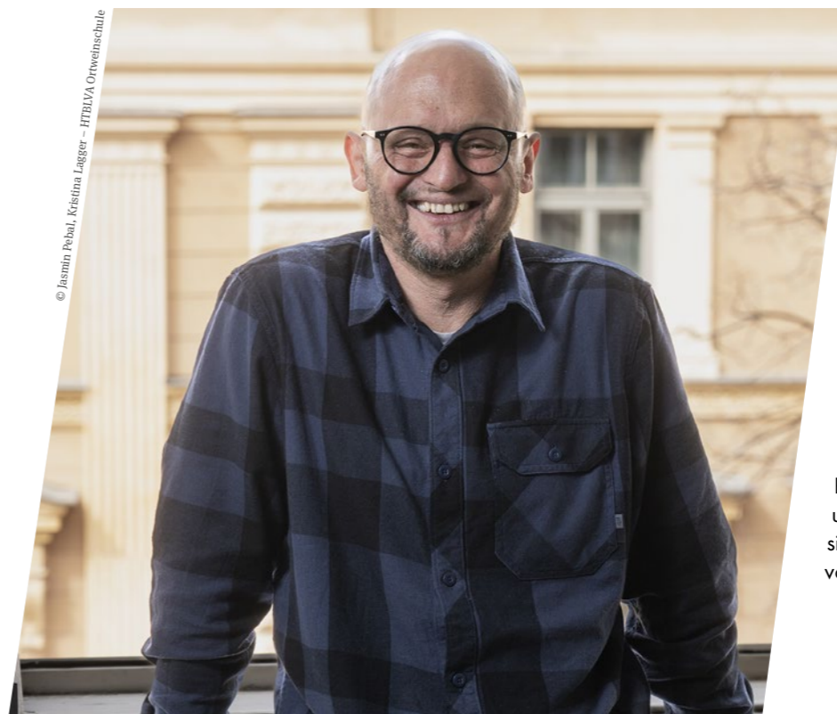
© Jasmin Pebal, Kristina Lagger - HTBLVA Ortwieschule

Neben Highlights wie dem Beschluss zum Neubau des Jugendfreizeitzentrums EggenLend gab es im vergangenen Jahr auch Projekte, die ihrer Umsetzung harren: die nötige Erweiterung des JUZ Andritz und ein JUZ mobil. Aufgegeben werden solche Projekte keinesfalls, denn ihre Wichtigkeit geht nicht verloren. Um die Erfolgsgeschichte der OKJA weiterzuschreiben und ihre Arbeit als positive Lobbyeinheit in Zukunft zu optimieren, haben die beiden einen Wunsch: eine gesetzlich verankerte Finanzierung der Jugendarbeit.