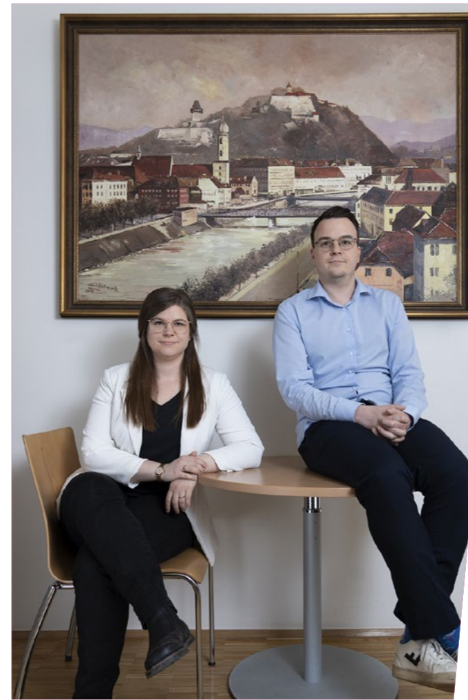
© Sofia Huber, Kristina Lagger – HTBLVA Ortweinschule