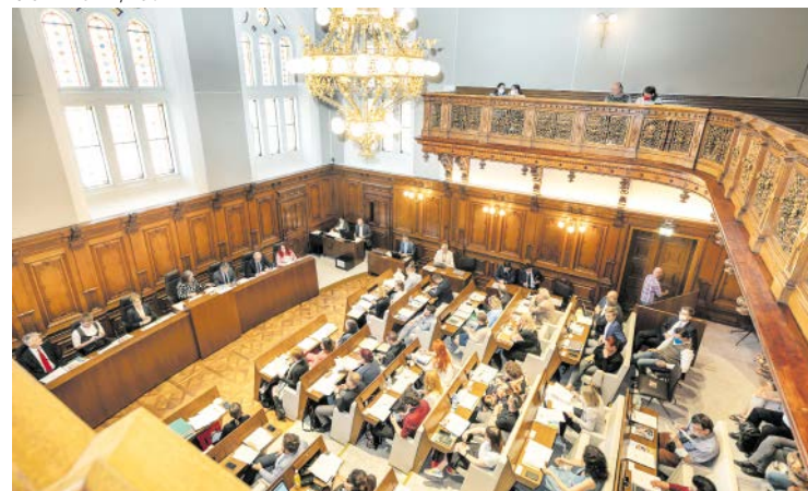
Nächste Sitzung: 12. Dezember, 12 Uhr. Live verfolgen unter: graz.at