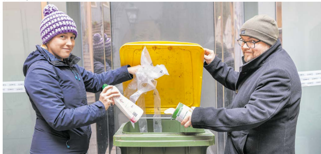
Noch umweltfreundlicher. Ab Jahresbeginn dürfen auch Metallverpackungen in die gelben Behälter hinein!