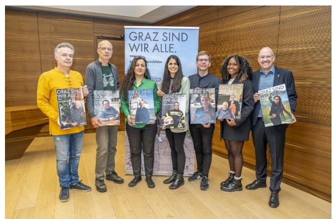
PK Lebensbilder