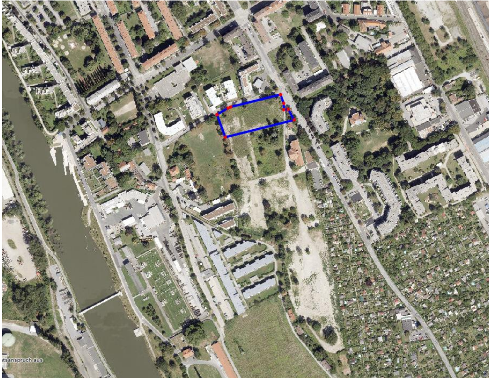
Luftbild (2022) GeoDaten-Graz: Der blaue Rahmen kennzeichnet das Bebauungsplangebiet.