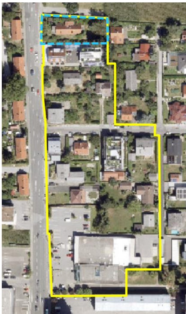
Luftbild (2022) Der gelbe Rahmen kennzeichnet das Bebauungsplangebiet. Der hellblau-strichlierte Rahmen kennzeichnet die Liegenschaft der Antragstellerin