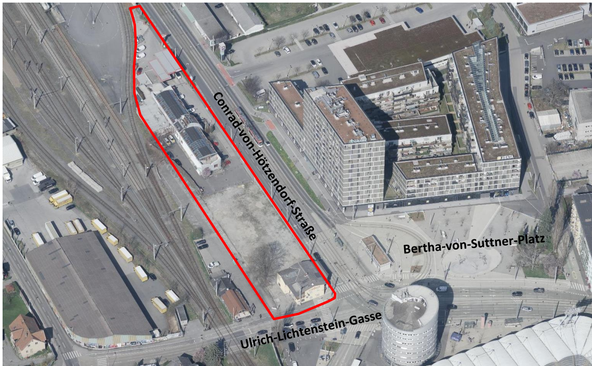
Schrägluftbild (2022): Auszug aus den Geo-Daten der Stadt Graz - Blick nach Norden Die rote Umrandung markiert das Bebauungsplangebiet.