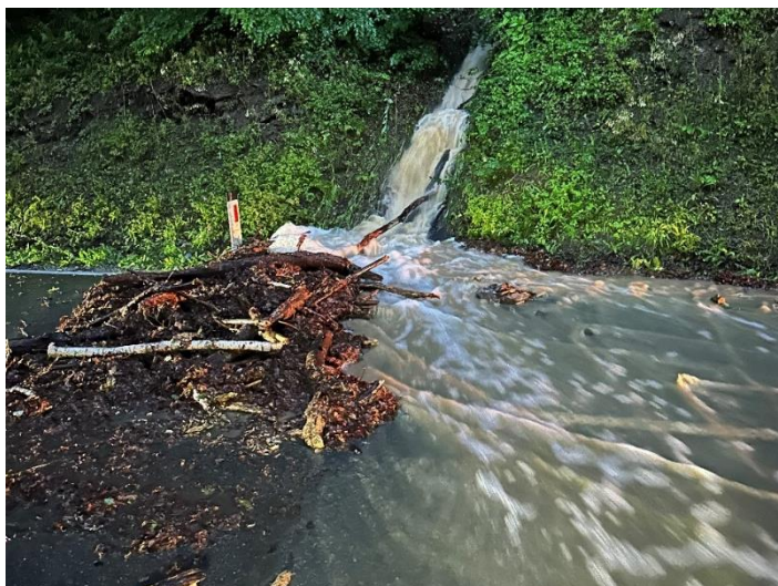
Nahezu unbekannter Hangzulauf Thalstraße (auf Höhe alter Tennisplatz)

Ein Zulauf besteht auf Höhe der Thalstraße 48 (oberhalb befindet sich ein großer Weingarten), oder auf Höhe des alten Tennisplatzes. Beide waren (weitgehend) unbekannt, sind jedoch massive Zuläufe, die durch fehlende oder unzureichende Maßnahmen die Thalstraße und viele Grundstücke überschwemmten.