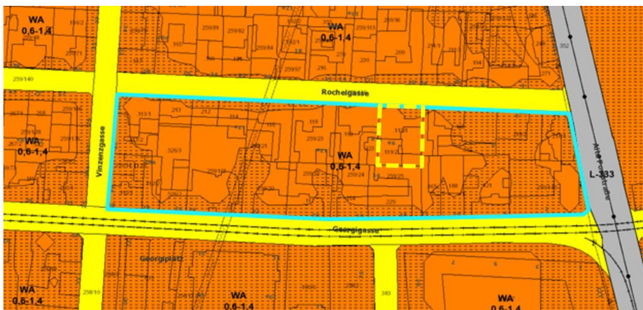
Auszug aus dem 4.0 Flächenwidmungsplan der Landeshauptstadt Graz idGF. Der hellblaue Rahmen kennzeichnet das Bebauungsplangebiet. Der gelb strichlierte Rahmen kennzeichnet die Liegenschaft des Antragstellers.